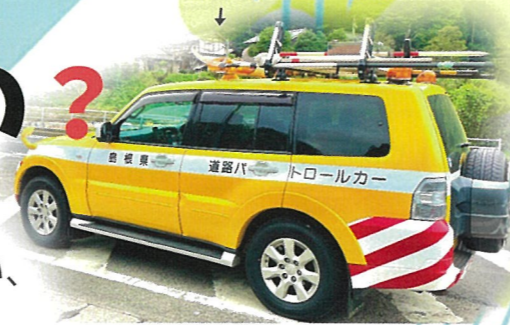
道路パトロールカー

作業員がパトロールカーで道路を巡回します。 道路の異常を発見した場合は、状況に応じた処置を行い、 道路の安全確保に努めています。